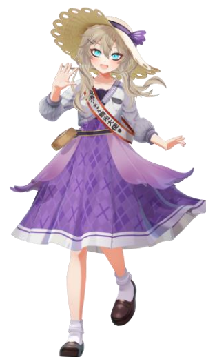
埼玉バーチャル観光大使 「春日部つくし」

平成30年からVTuberとして活動中。埼玉県をもっと身近に、心の故郷にしてもらえることを目標に、活動を行っています。令和3年7月から実施した埼玉バーチャル観光大使オーディションを勝ち抜き、令和3年12月に埼玉バーチャル観光大使に任命されました。