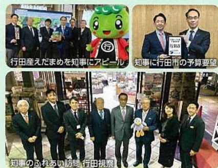
行田産えたまめを知事にアピール