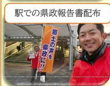
駅での県政報告書配布

行田在来の枝豆を石井市 長と行田豆吉クラブの皆さん と一緒にトップセールスを行 いました。知事からは香り 豊かで何度も食べたくなる 味だと好評いただきました。