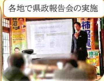
各地で県政報告会の実施