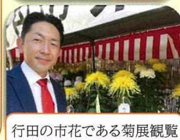
行田の市花である菊展観覧

地域の子ども達と春に植 えた古代米の稲刈りを地元育 成会事業で行いました。 食育を通して食のありがた みや、農業の大切さを共に 学んでいます。