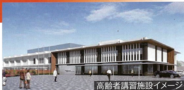
高齢者講習施設イメージ