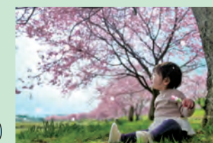
ベストショット賞 「春満喫」