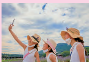
議長賞 「思いに残った」