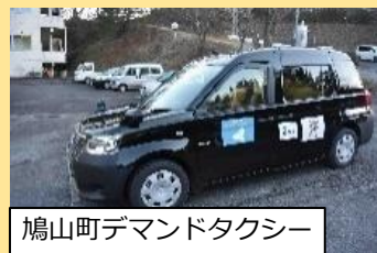
鳩山町デマンドタクシー

概要 鳩山町の人口集中地域である鳩山ニュータウン地区に整備した、はーとんスクエア及び鳩山町コミュニティ・マルシェを中心に、地域の拠点となる機能を設置・拡充して都市機能の集約化を目指す。