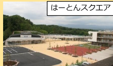
はーとんスクエア