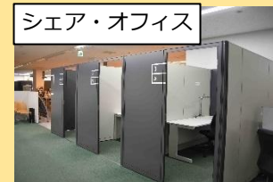
シェア・オフィス