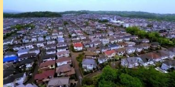
老朽空き家等の解消及び入替促進