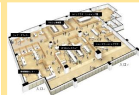
鳩山町コミュニティ・マルシェ