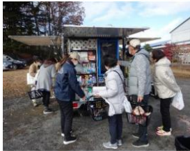
▲移動販売車のイメージ