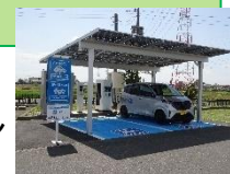
充電ステーション