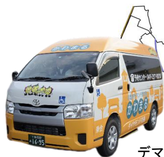
デマンド型交通 「かわまる」