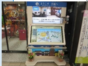
観光案内所の デジタルサイネージ