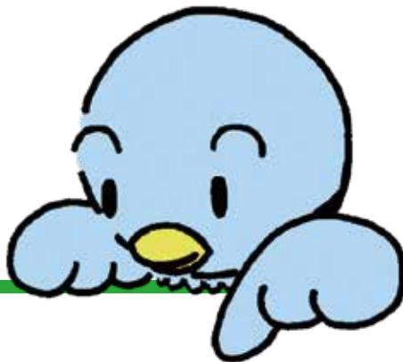
県議会マスコット 「ポッポ」