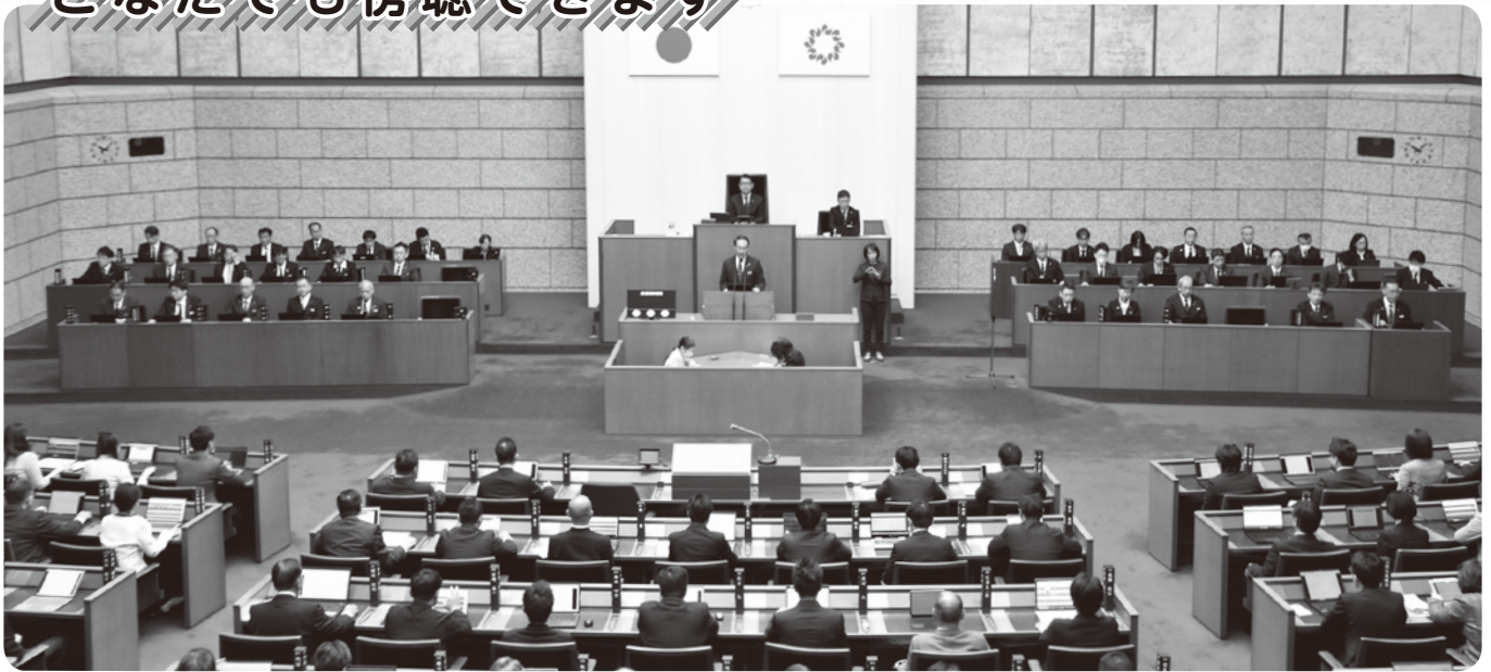
本会議場（令和5年12月定例会）

県議会の本会議は、県議会議事堂4階の傍聴者受付で手続きをしていただければ傍聴ができます。本会議の傍聴席は216席です。傍聴席とは別室で、乳幼児・児童のお子様と一緒に気兼ねなく傍聴できる専用スペースもご用意しています。