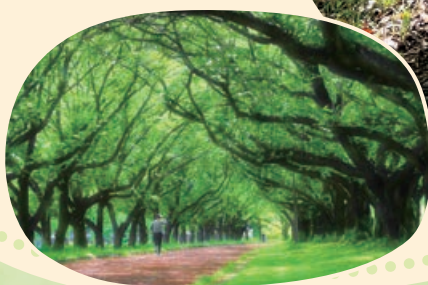
身近な緑の部 最優秀賞「新緑トレーニング」(川越市)