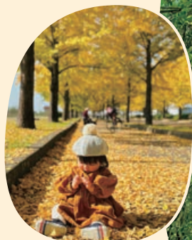
身近な緑の部 最優秀賞「初めての秋」 (加須市)

応募は郵送とInstagram 「#緑のトラストフォト2023」 で応募できます。