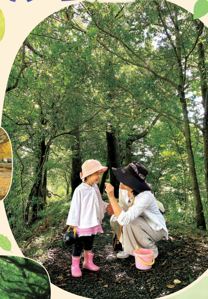
第23回 トラスト保全地の部 最優秀賞「ドングリ見〜つけ!!」 (トラスト10号地)