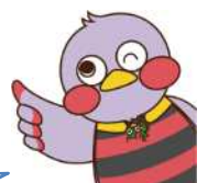
埼玉県のマスコット「さいたまっちゃん」

EMSで設備の稼働状況を自動収集できると、 データ回収・集計の作業時間の節約 につながる！