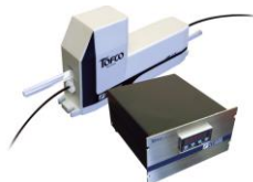
FLC4000 薬液対応流量コントローラ ■超音波流量計内蔵 ■エア駆動弁式