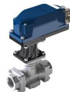
FCV-M/MCV-M 電動比例制御バルブ ■超高分解能、高速応答 ■高温・低温対応