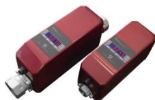
FLC-E 汎用流量コントローラ ■電磁流量センサ内蔵 ■最大 5~100L/min