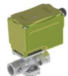
FCV-N 電動比例制御バルブ ■アンプー体型 ■ローコストタイプ