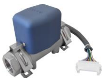
FLC700 汎用流量コントローラ ■流量計内蔵 ■50L/min、100L/min