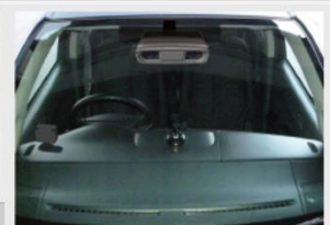
自動車の自動運転