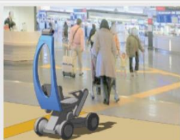
空港内の電動車椅子