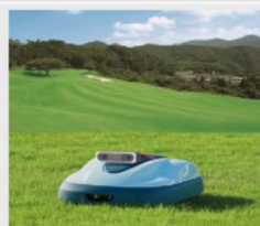
ゴルフ場自動芝刈り機