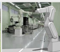
自動組立てロボット