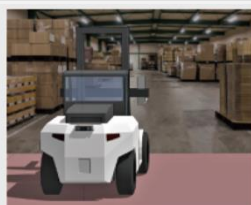
倉庫のフォークリフト