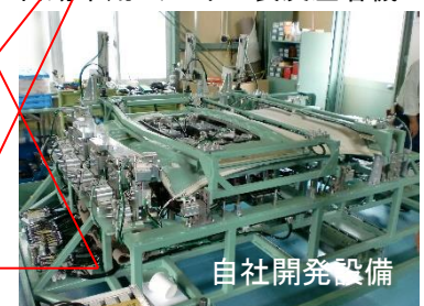
自動車用ルーフ巻込み治具