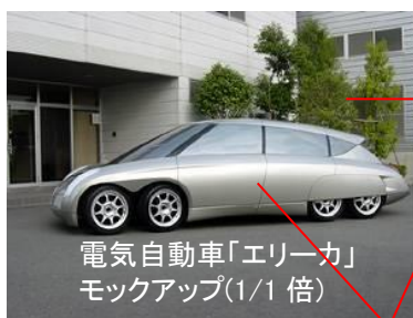
慶應義塾大学殿納入