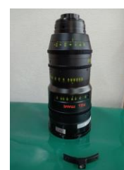
シネマレンズ匠シリーズ

加工上がりの部材をラップ（研磨）、洗浄、ガタ量を測定後、可動部組付作業、トルク測定及び、平行度測定を行い鏡胴部を組立ております。