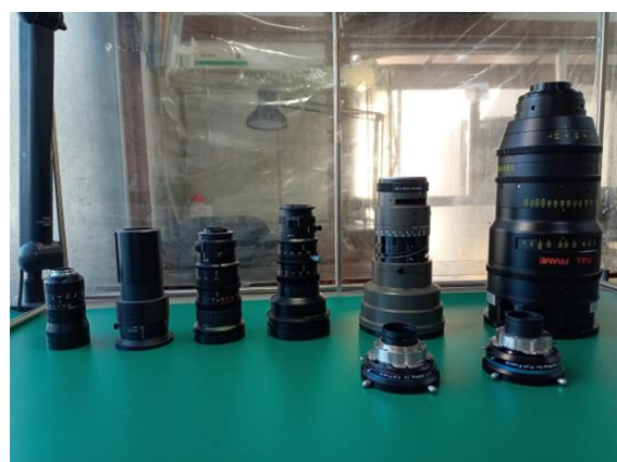
今まで組立てた鏡胴 CCTV、業務用、シネマレンズ等

当社では長年にわたり富士フイルム、タムロン、武蔵オプティカルシステム等の光学鏡胴部の組立を携わっており、この組立技術は、ロボット作りの可動部等に活用可能です。