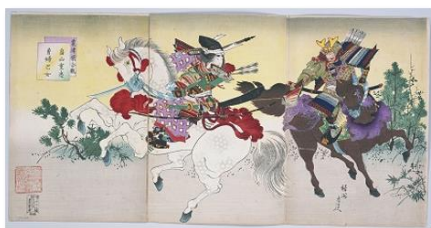
粟津原合戦 富山重忠・勇婦巴女 楊洲周延(画) 長谷川常二郎 1894