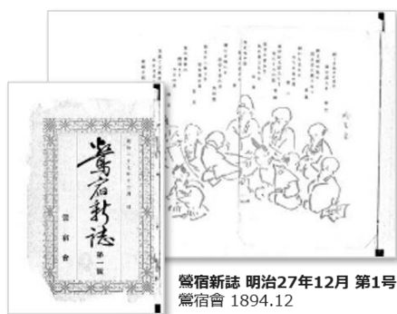
鶯宿新誌 明治27年12月 第1号 鶯宿會 1894.12