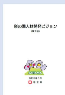
彩の国人材開発ビジョン 埼玉県 埼玉県 2021