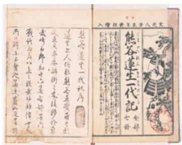
熊谷蓮生一代記 全7冊 葛原斎仲通著 河内屋和助 1811