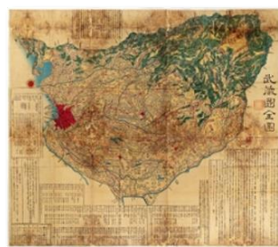
武蔵国全国 菊地武辰著 長瀬為一郎 [1856(安政3)]