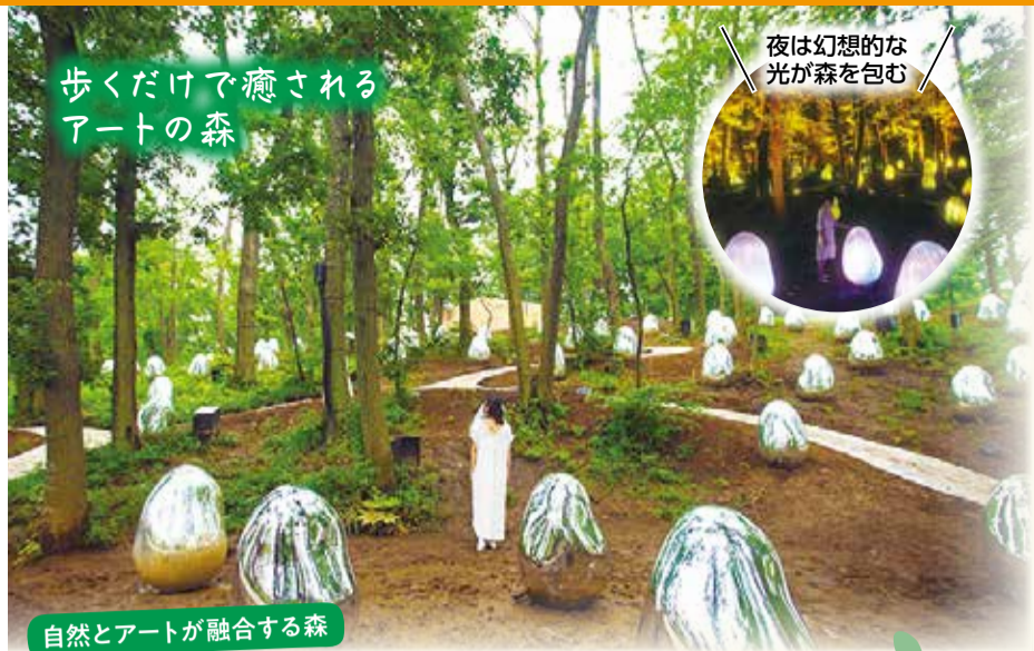
歩くだけで癒される アートのある森