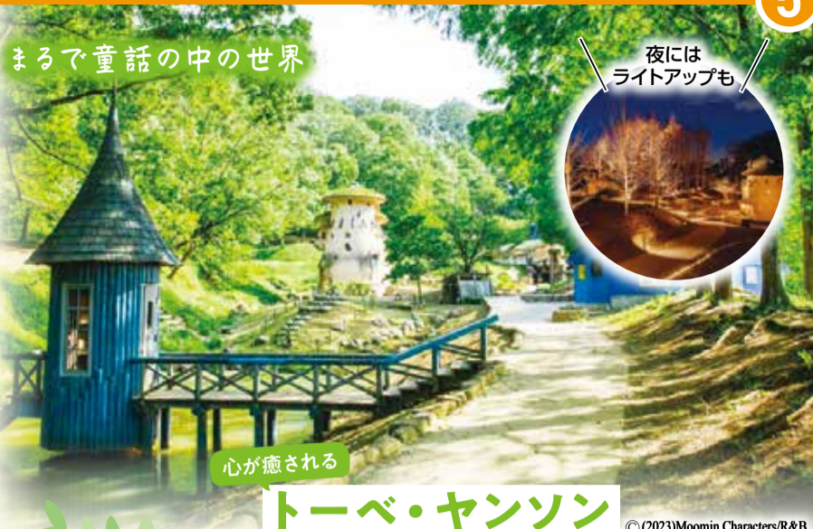
まるで童話の中の世界