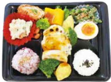
▲「からだ健やか」彩り野菜と豆腐ハンバーグの雑穀ごはん弁当(コープみらい)

県内のイオンリテール、ベルク、コープみらいの各店舗で、食塩控えめで野菜たっぷり、愛情込もったおいしいお弁当を販売しています。★商品名は各スーパーマーケットにより異なります。取り扱いについては、店舗に直接確認してください。