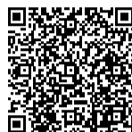
▲埼玉県健康づくり協力店はこちら

衛生状態が良好で、メニューの栄養成分表示や埼玉県コバトン健康メニューなどバランスのとれた食事を提供している飲食店を認証しています。