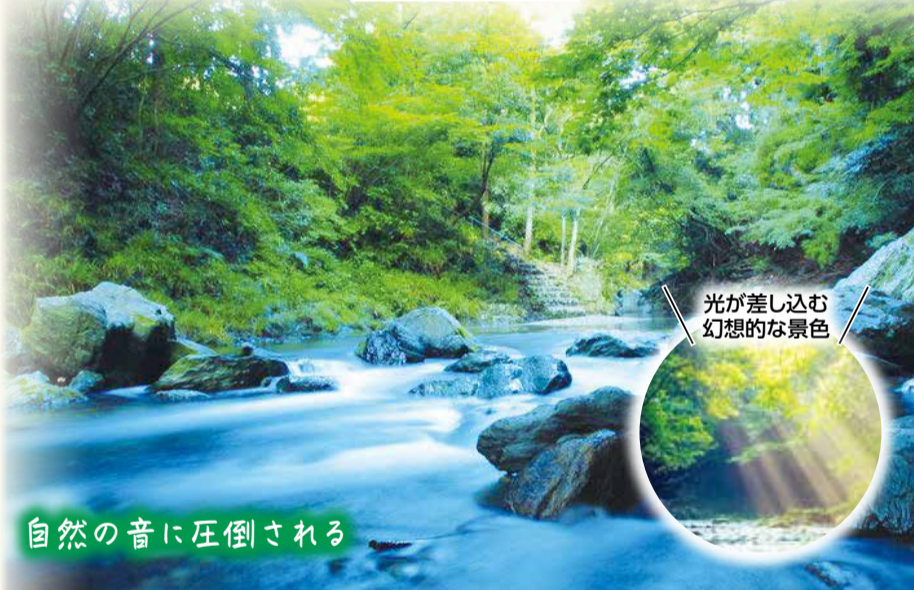
自然の音に圧倒される