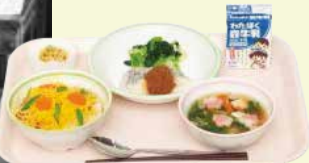
▲今の学校給食(さいたま市立本太中学校)