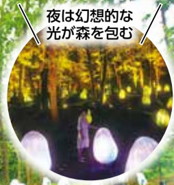
夜は幻想的な 光が森を包む