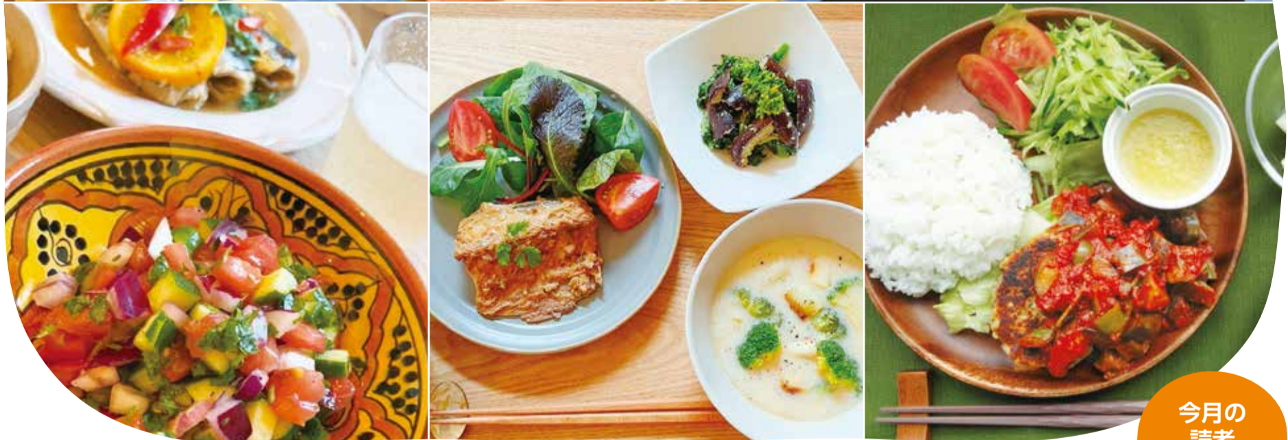
▲埼玉県コバトン健康メニュー：左から、モロッコサラダ、タンドリー・フィッシュ、イタリアンSABA〜く！