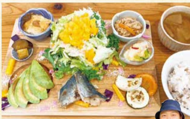
▲旬の野菜が盛りだくさんのお野菜プレート