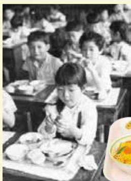
◀昔の学校給食の様子

子供の食育には欠かせない、学校給食。完全給食(主食・副食・牛乳)を実施している小・中学校などでは、伝統的な郷土料理や行事食に関連したメニューや県産の米や小麦、野菜など地場産の食材を使ったメニューなどが取り入れられています。