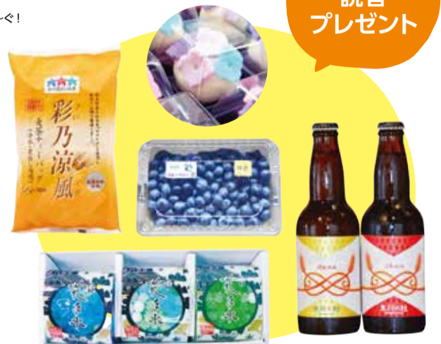
★写真はイメージです。