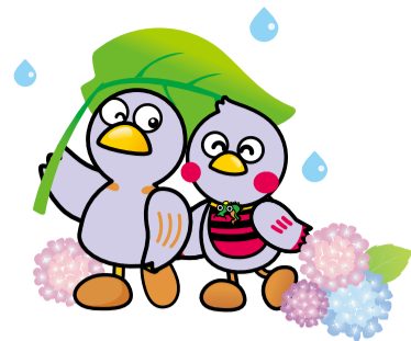
埼玉県マスコット「コバトン」「さいたまっち」