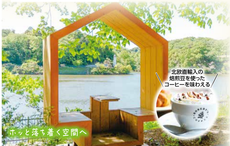
ホッと落ち着く空間へ