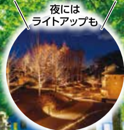
夜には ライトアップも