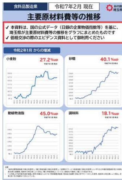
価格交渉支援ツール