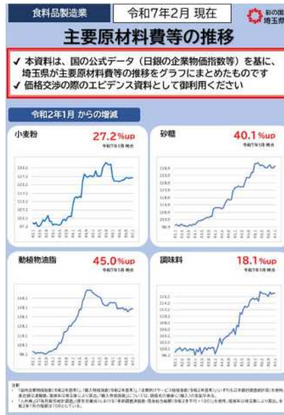
価格交渉支援ツール