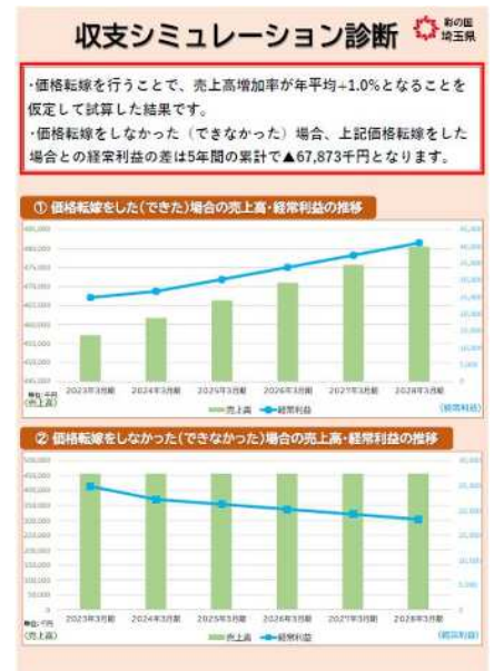
収支計画シミュレーター