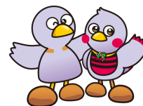
埼玉県マスコット