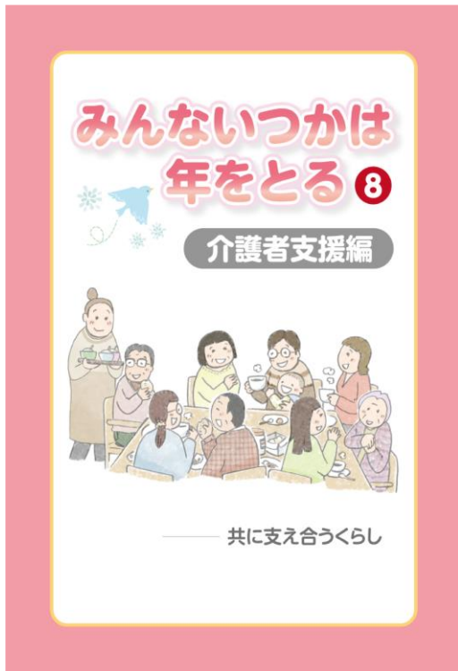
第8巻 介護者支援編