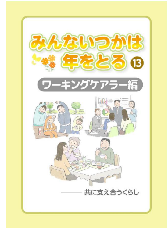
第13巻 ワーキングケアラー編