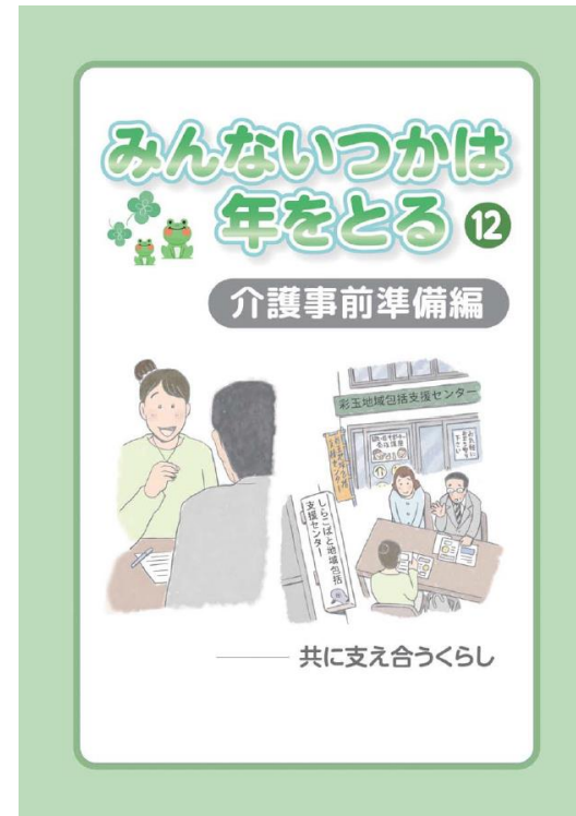
第12巻 介護事前準備編