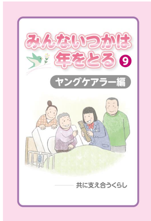
第9巻 ヤングケアラー編