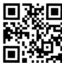
公式ウェブサイト