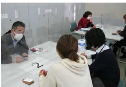
情報交換会（異業種マッチング）