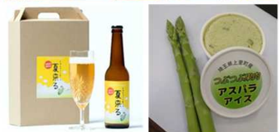
「農業発！新商品お披露目会」で商品紹介