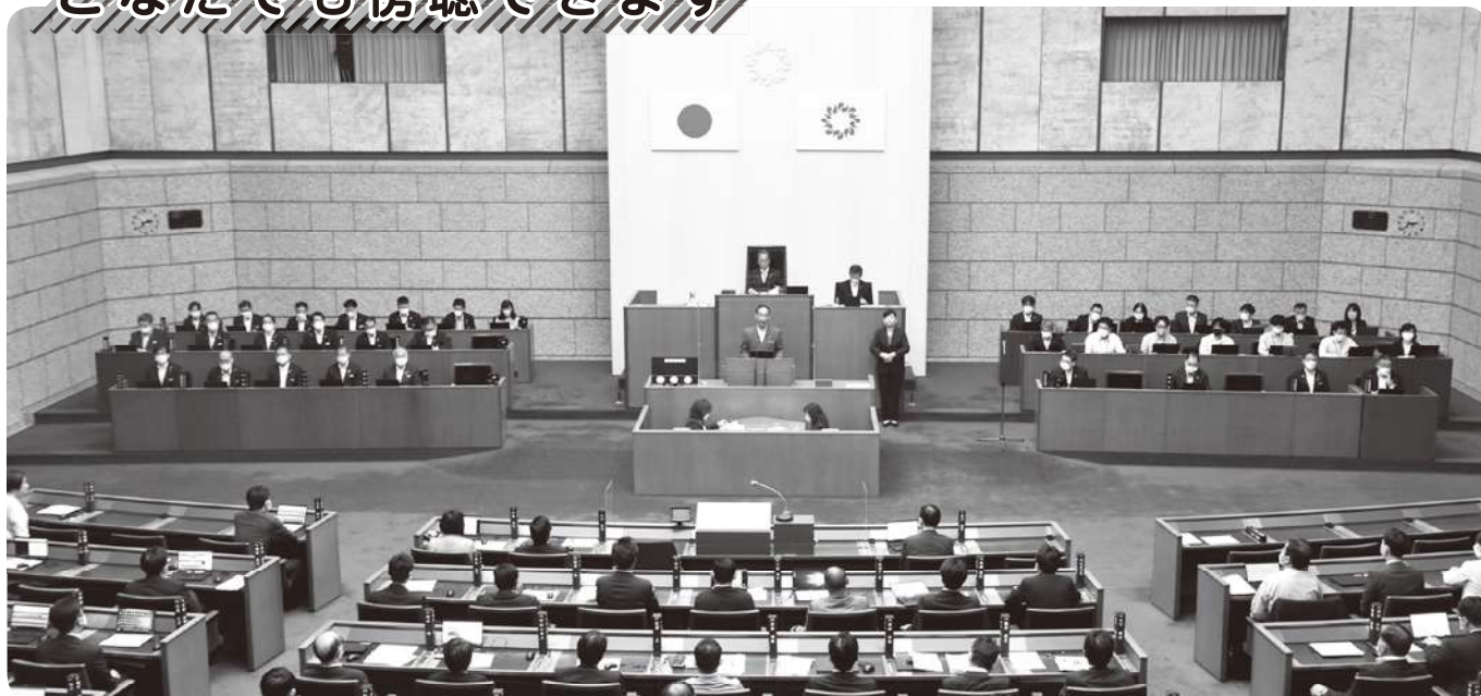
本会議場（令和4年9月定例会）

県議会の本会議は、県議会議事堂4階の傍聴者受付で手続きをしていただければ傍聴ができます。本会議の傍聴席は216席です。また、委員会も受付で手続きをしていただければ傍聴ができます。ご用意している傍聴席は、各委員会とも20席です。本会議、委員会ともに車いすのままでも傍聴ができます。