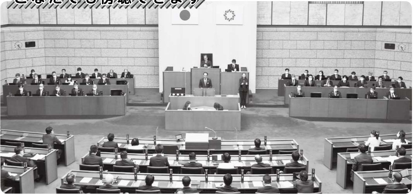
本会議場（令和4年2月定例会）

県議会の本会議は、県議会議事堂4階の傍聴者受付で手続きをしていただければ傍聴ができます。本会議の傍聴席は216席です。また、委員会も受付で手続きをしていただければ傍聴ができます。ご用意している傍聴席は、各委員会とも20席です。本会議、委員会ともに車いすのままでも傍聴ができます。