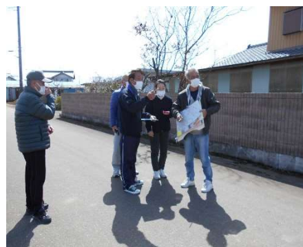
◆ 防災まち歩きの様子（左：中郷地区、右：市場地区）