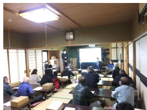
◆地区防災計画説明会の様子