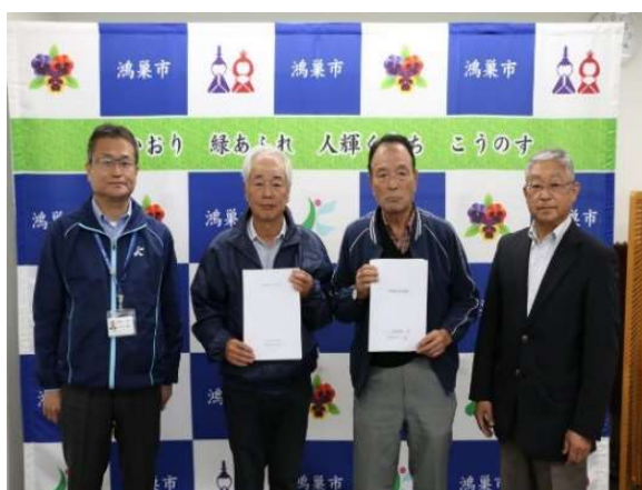
◆鴻巣市へ素案を提出

その後、鴻巣市の防災会議の承認を経て、令和5年3月に鴻巣市地域防災計画資料編に掲載され、これをもって両地区の地区防災計画が完成しました。