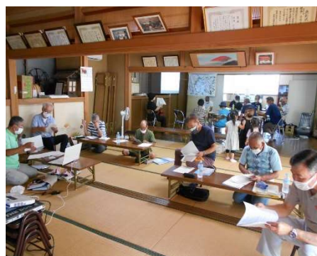
◆ 素案作成の様子 1