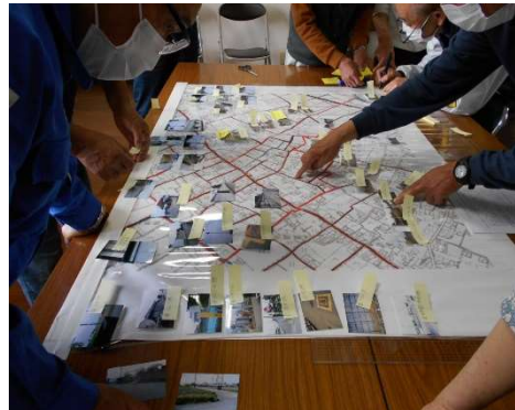
◆防災マップ作成の様子 (左：中郷地区、右：市場地区)

中郷地区・市場地区の方々が作成した防災マップは、それぞれの地区防災計画に掲載されています。