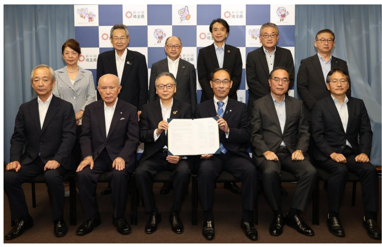
▲「価格転嫁の円滑化に関する協定」締結式の様子 (令和4年9月8日)

✓ 産官金労の12団体で価格転嫁の円滑化に関する協定を締結し、「適切な価格転嫁」の気運醸成に連携して取り組んでいます