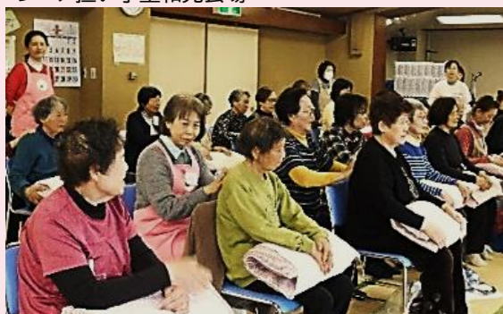
所沢市老人福祉センター・あづま荘