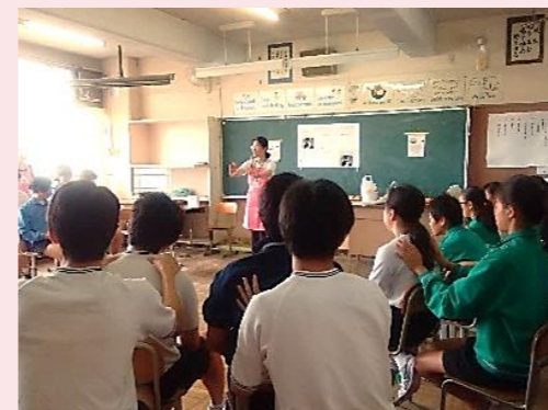
さいたま市立中学校