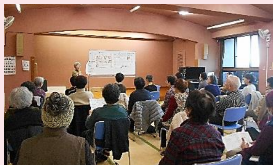
所沢市老人福祉センター・さやまがおか荘