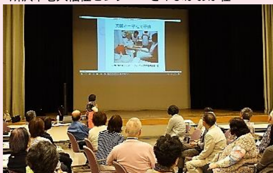
シニア担い手塾和光会場