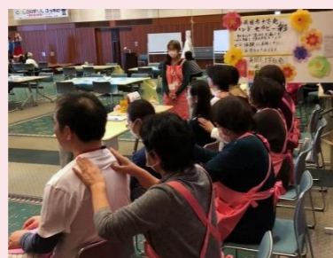
川口市COLORFUL(カラフル)ふえすた

「ハンドセラピー養成講座」「地域ふれあい講座」「こころのふれあい講座」の講習会を通して、学んだ知識と技術を活かし、日常生活でのコミュニケーションをとるツールとしてケア施設への訪問・イベント参加などへの地域でのボランティア活動を支援しています。