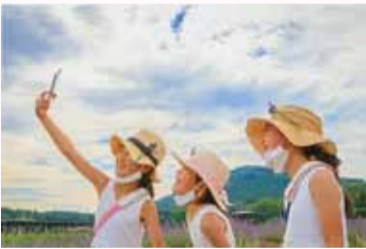
撮影場所：嵐山町 ラベンダー園