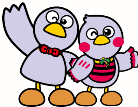
埼玉県マスコット 「コバトン」「さいたまっち」

平成18年、子育て支援団体「保育グループふうせん」を立ち上げ、平成25年、NPO法人ふうせんを設立。子育て広場の運営で年間延べ600組以上の親子と出会う。令和2年7月、当法人が運営するママ応援カフェ・ソニードをオープン。