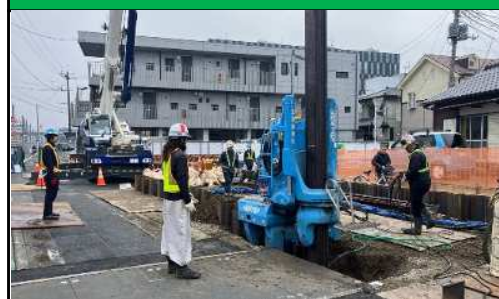
土留め工施工状況