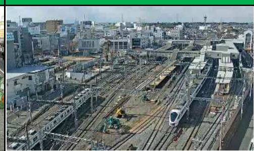
春日部駅構内工事施工状況