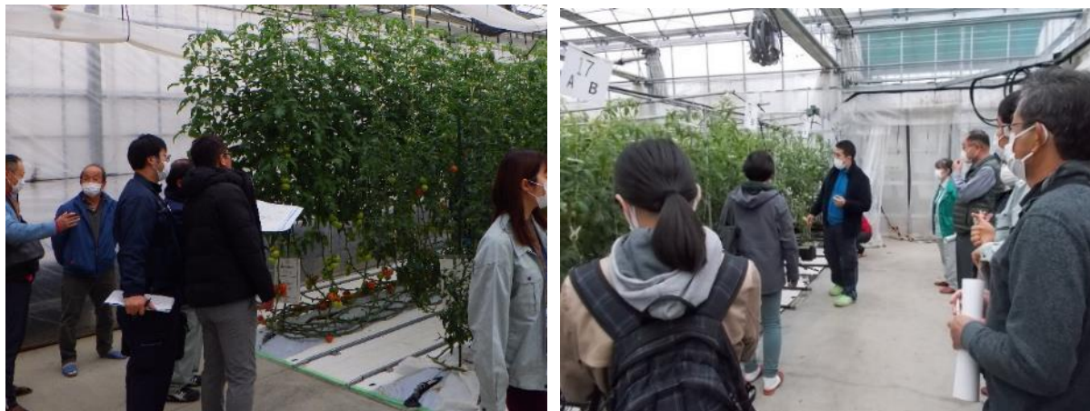
図3 実証ラボ定例研修会での意見交換 (左：実証ラボ、右：次世代施設園芸埼玉拠点)