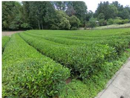
(写真: 綺麗に管理された茶園)