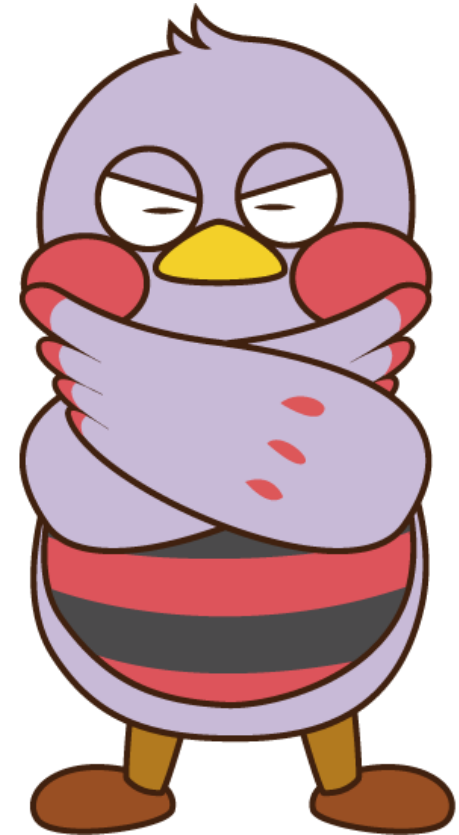
埼玉県マスコット「さいたまっち」