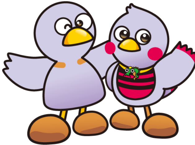
埼玉県マスコット「コバトン」「さいたまっち」