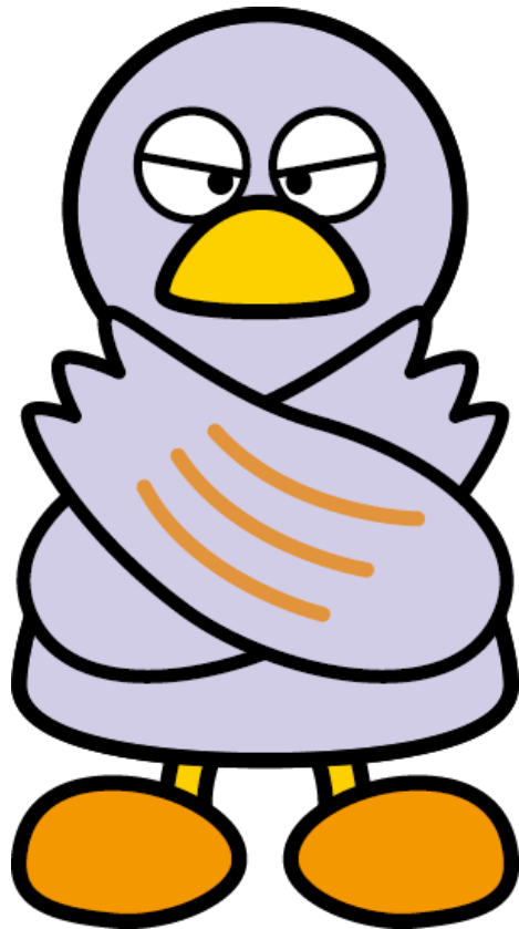
埼玉県マスコット「コバトン」