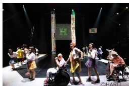
障害のある方々の 舞台公演の実施