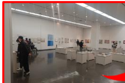
障害のある作家の アート作品の展示