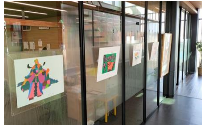
オフィスの通路スペースでの展示

来客の目にも届きやすいオ フィスの通路スペースに障害 者アートを展示。華やかで印 象に残る空間を創出。