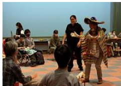
障害のある方向け ワークショップ開催