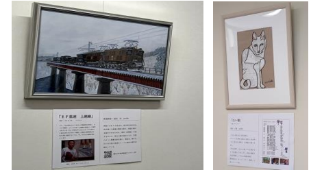
来客応接室での展示

来客用の応接室に障害者 アートを展示。存在感ある 絵画が室内に彩りを添えて いる。