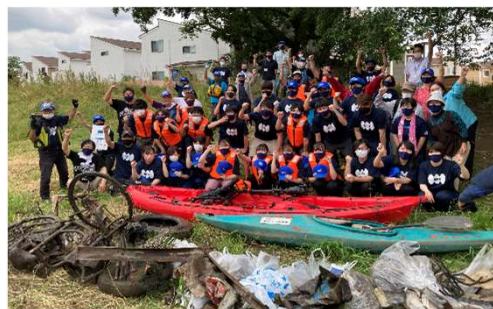
カヌーでのごみ拾い