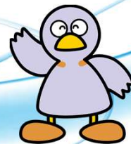
埼玉県マスコット コバトン

みんなで選ぶ「リバサポアワード」では、 川での優れた活動や川の魅力を伝える画像を 県民の皆さんに選んでいただき、広く発信します。 初めに投票の対象となる活動のエントリーを開始します！