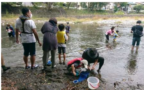
初めての川での釣り体験