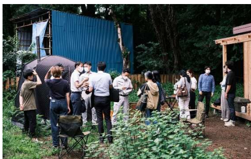
川辺でのワーケーションイベント