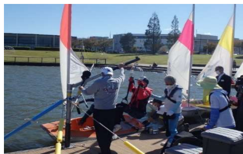
企業がヨットの障害者リフトを応援団に寄贈