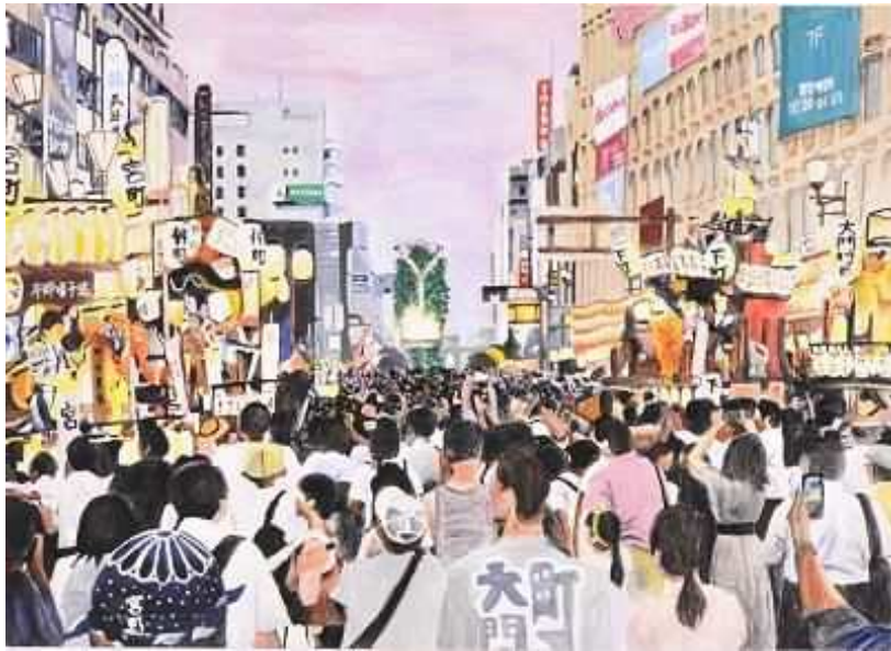
『輝き続ける大宮の夏祭り』