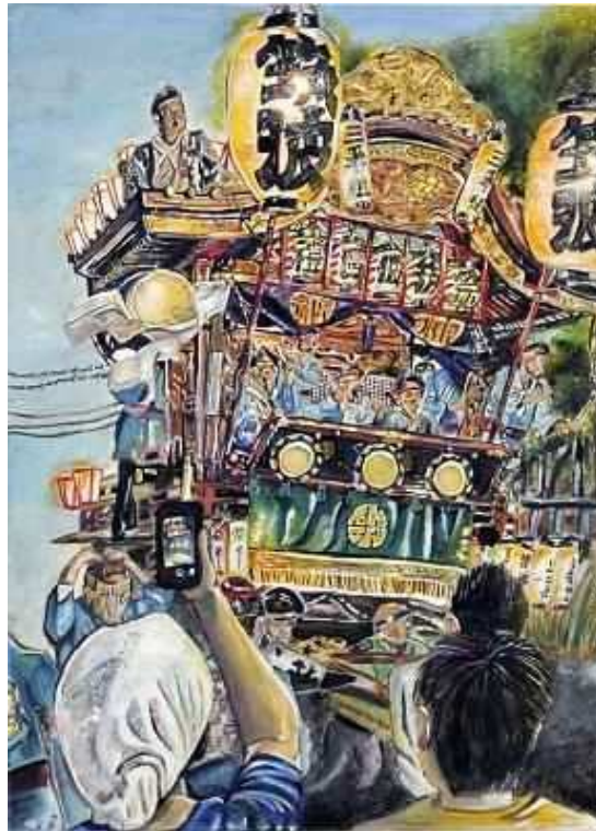
『熱気溢れる熊谷うちわ祭』