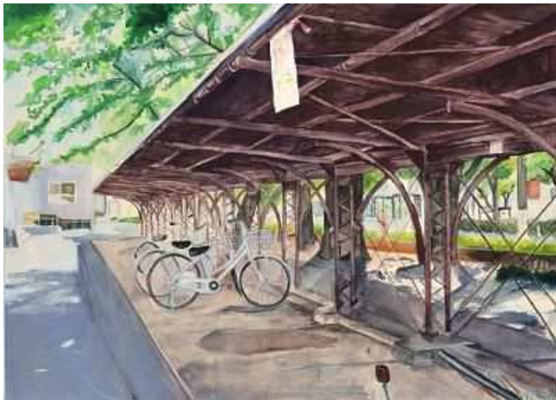
『晴れの日自転車置き場』