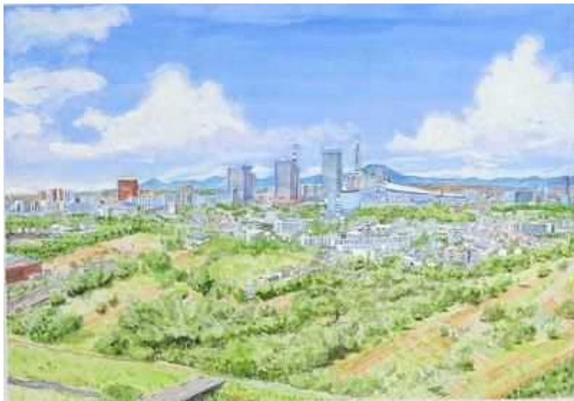
『緑に囲まれたさいたま新都心』