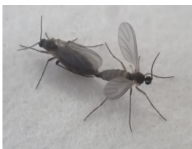
写真1 ネギネ成虫（左：雌、右：雄）