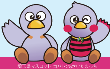
埼玉県マスコット コバトン&さいたまっちゃん