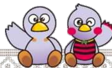
埼玉県マスコット コバトン&さいたまっち