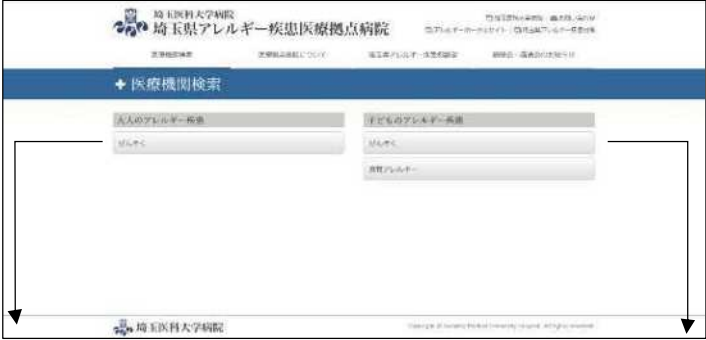
大人の気管支ぜん息