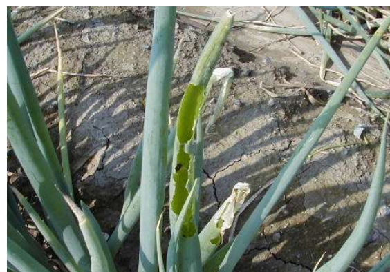
写真2 シロイチモジヨトウによる被害葉