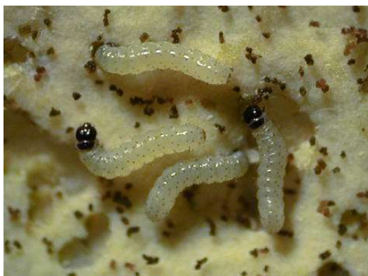
写真1 シロイチモジヨトウ若齢幼虫 (体長約2mm)