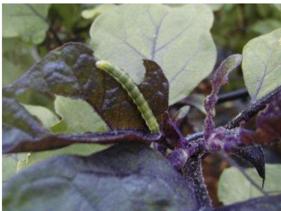
写真1 オオタバコガ幼虫による葉の食害