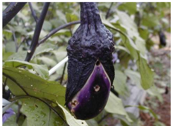
写真2 オオタバコガ幼虫による果実の侵入痕