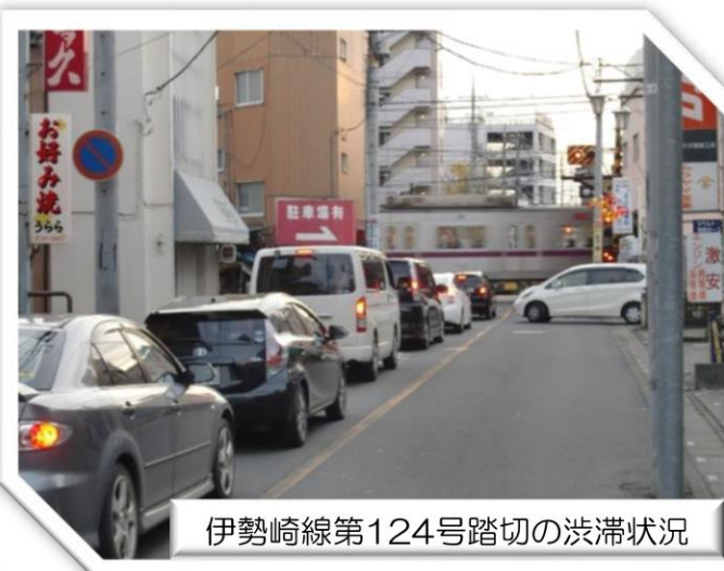
伊勢崎線第124号踏切の渋滞状況