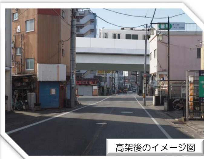
高架後のイメージ図