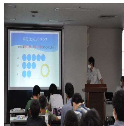
令和3年度の夏休み親子統計教室の様子

埼玉県川越地方庁舎 4階大会議室(川越市新宿町1-17-17 ウェスタ川越内) JR川越線・東武東上線「川越駅」西口から徒歩約5分、 西武新宿線「本川越駅」から徒歩約15分