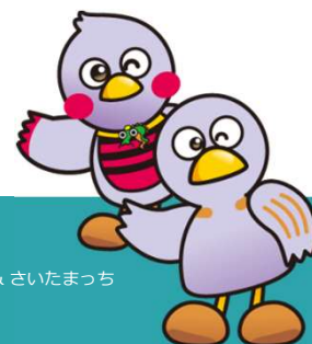
コバトン & さいたまっち