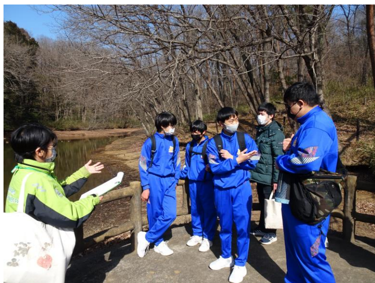
「あざみくぼ沼」に「ミヤコタナゴ」の復活を