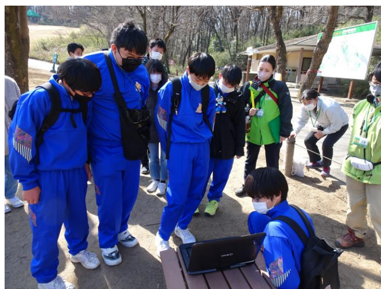
「夜行性野生動物」を観察しよう