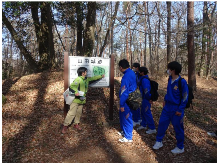
もし「山田城」を攻め落とすとしたら

○高校進学を前にとってもいい思い出になった。「ベアリス」が開校してから5年連続で参加したが、来年は参加はできないのかな、可能であれば何らかの形で参加させたいと思う。