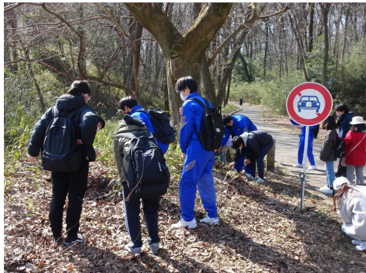
国蝶「オオムラサキ」の幼虫を探せ