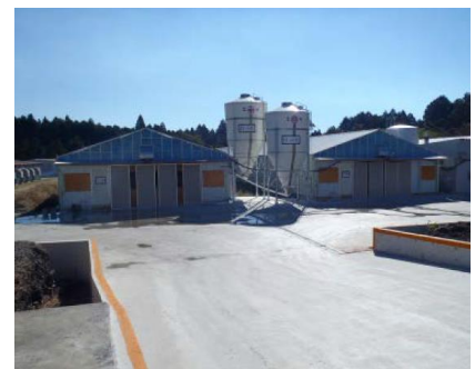
←色付部分に石灰を散布