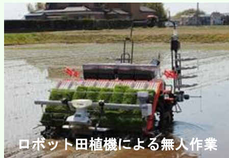
ロボット田植機による無人作業

土地利用型農業を中心に、RTK基地局による自動操舵システムや、ロボット田植機、ほ場管理システム、ドローン等のスマート農業の導入が進んでいます。