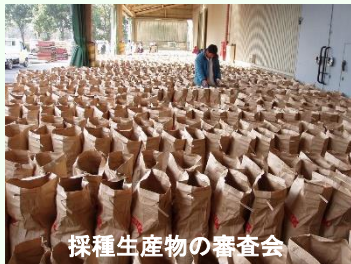
採種生産物の審査会

水稻、麦の種子生産が行われています。特に「彩のかがやき」は県内全ての種子が管内で生産され、県産米の安定供給に役立っています。