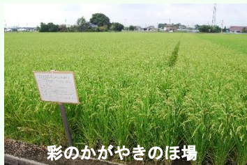
彩のかがやきのほ場

水稻の作付面積は7,300ha（令和4年産）と県内の26%を占め、特に加須市は4,180ha（令和4年産）と県内一の産地です。主な品種は「彩のかがやき」「コシヒカリ」「彩のきずな」で、良食味米生産に取り組んでいます。