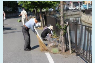
地域住民による美化活動(会の川)