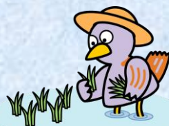
埼玉県のマスコット コバトン