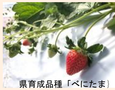
県育成品種「べにたま」

いちごは品種「やよいひめ」「紅ほっぺ」の他、急激に増加している県育成品種「べにたま」「あまりん」が加須市を中心に栽培されています。また、一部高設栽培施設を導入した観光摘み取りも行われています。