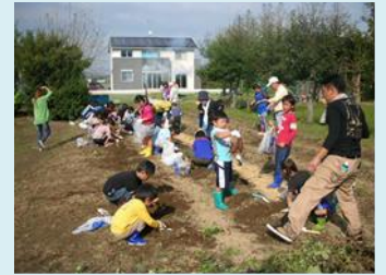
子供会と芋ほり体験