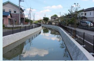
整備工事が完了した「会の川」

令和3年度からは「水辺周辺活用事業（農業用水）」として、会の川地区（加須市）、ヘルシー・ふれあい地区（行田市、加須市、鴻巣市）において、水路整備や歩道等の整備を実施していきます。