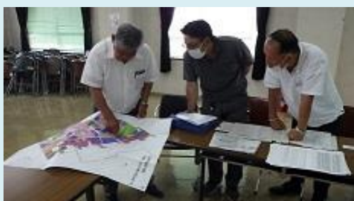
再配分会議で農地の集積・集約を検討

管内では、担い手への農地の集積・集約化の取組を積極的に進めています。関係機関が強力に連携して事業推進を行い、県全体の実施（転貸）面積の約4割（4,254ha：令和4年度末）を占める県内一の先進地です。