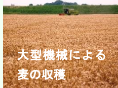
大型機械による 麦の収穫

大豆は211ha（令和4年産）作付けされ、主な品種は「里のほほえみ」です。その他、甘みが強く香りの高い「行田在来青大豆」が復活しています。