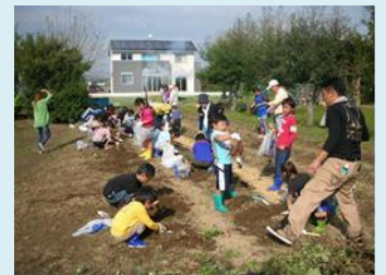
子供会と芋ほり体験