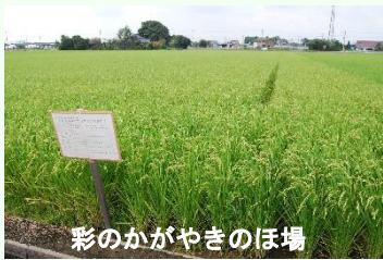
彩のかがやきのほ場

水稻の作付面積は8,250ha（令和2年産）と県内の26%を占め、特に加須市は4,650ha（令和2年産）と県内一の産地です。主な品種は「彩のかがやき」「コシヒカリ」ですが、近年「彩のきずな」も増えていて、良食味米生産に取り組んでいます。