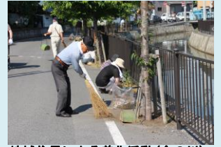
地域住民による美化活動（会の川）