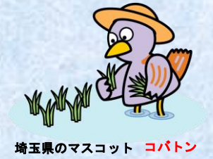
埼玉県のマスコット コバトン