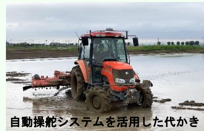
自動操舵システムを活用した代かき

土地利用型農業を中心に、RTK基地局による自動操舵システムや、ロボット田植機、ほ場管理システム等のスマート農業の導入が進んできています。