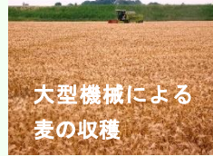
大型機械による 麦の収穫

麦は小麦、ビール麦（二条大麦）、六条大麦の合計で1,265ha（令和2年産）が栽培されています。品種は、小麦は「あやひかり」、ビール麦は「彩の星」で高品質生産に取り組んでいます。大豆は179ha（令和2年産）作付けされ、主な品種は「里のほほえみ」です。その他、甘みが強く香りの高い「行田在来青大豆」が復活しています。