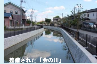
整備された「会の川」 （川の国埼玉はつつプロジェクト）

令和3年度からは「水辺周辺活用事業（農業用水）」として、会の川地区（加須市）、ヘルシー・ふれあい地区（行田市、加須市、鴻巣市）において、水路整備や歩道等の整備を実施していきます。