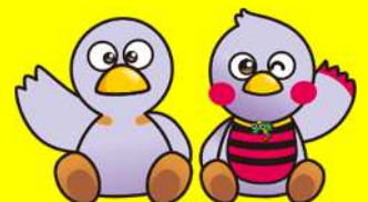
コバトン さいたまっち